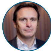
DETROUSSELLE Guy Médiamétrie