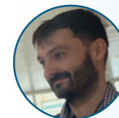
LE BARS FLORIAN LA SKOL