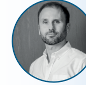
VERBIGUIE Regis Radioplayer