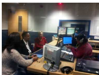
Bradford, United Kingdom