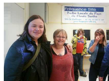
Une réflexion européenne intergénérationnelle – Inter-generational european collaboration