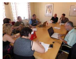
Workshop in Eskilstuna, Sweden