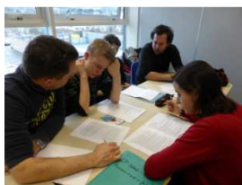
Workshop in Dublin, Ireland

Le principe du consensus a guidé les travaux.