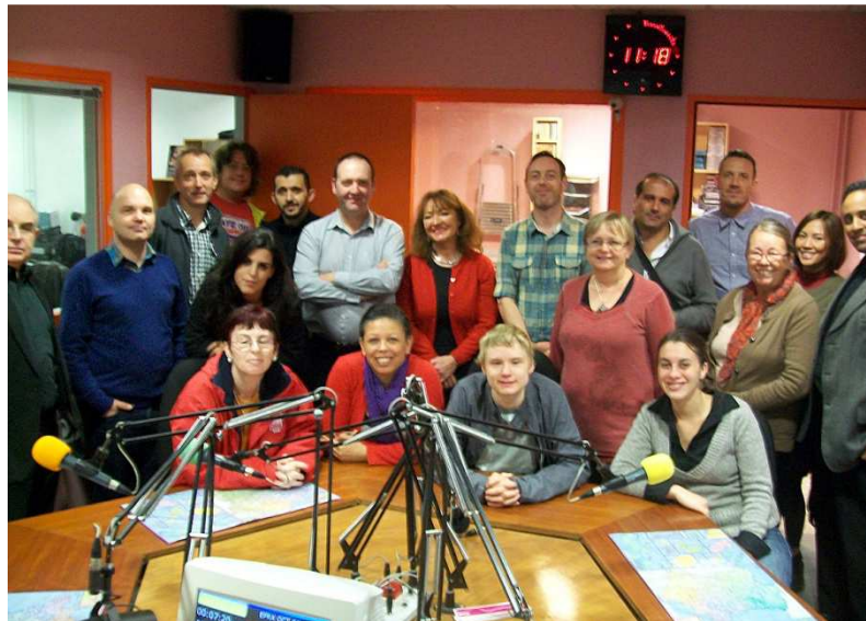
Studio visit and broadcast in Sillé, France