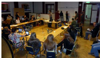
Meeting in Eskilstuna, Sweden

* Notre groupe considère que l'apprentissage non formel doit intégrer des «objectifs d'apprentissage».