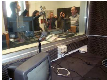
Studio visit in Dublin, Ireland

Vous pourrez utiliser ce livret dans vos démarches d'engagement associatif ou professionnel en Europe. Ce livret de compétences est reconnu par la profession à travers toute l'Europe comme étant une validation des compétences acquises dans la radio, considérant que l'éducation non-formelle et informelle, comme formelle, doivent être prises en compte.