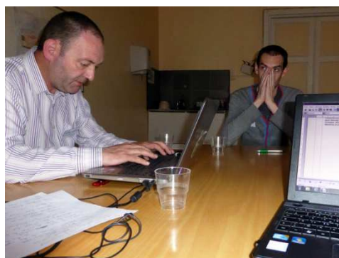
Validation des compétences, une réflexion approfondie !! Developing ways to better recognize skills !!