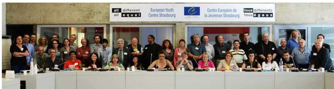
Les projets européens sur la reconnaissance des salariés et bénévoles se rencontrent à Strasbourg (juin 2013)

In June 2013 European project participants met in Strasbourg to work on the recognition of professional staff and volunteers in Community Radios.