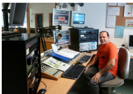
Studio in Wiltz, Luxemburg